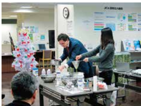
2013年12月21日(土) アメリカ文化講座「エッグノッグ」