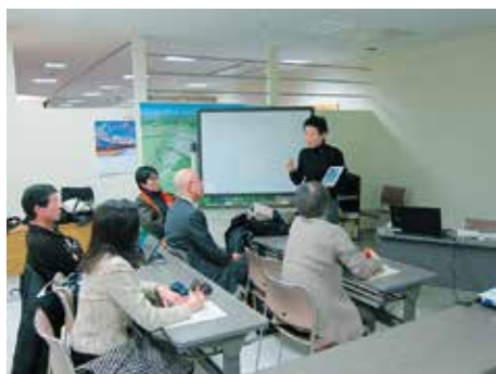
2014年1月14日(火) 留学相談会&eLibraryUSA 講習会