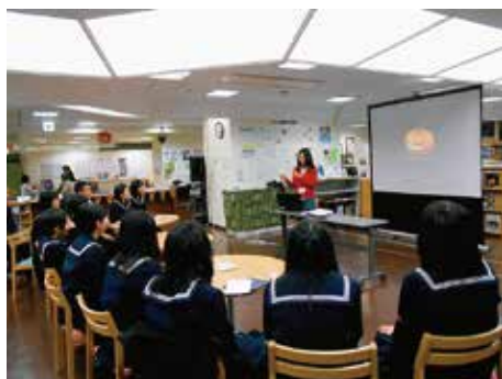
2013年10月24日(木) アメリカ文化講座「ハロウィン」