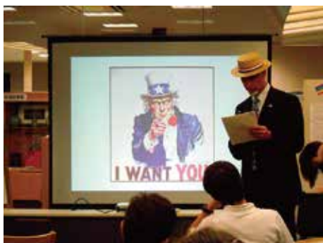
2013年6月26日(水) アメリカ文化講座 「星条旗から読み解くアメリカ独立の歴史」