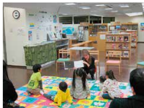
2013年11月2日(土) 絵本の読み聞かせ