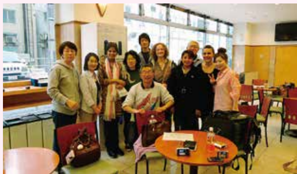
平成25年度JICA母子保健研修ホームステイの様子

春から夏にかけて旭川市にはJICA研修員が多く滞在します。AICではホームステイボランティアの皆さまのご協力で1泊2日のホームステイを毎年実施し、珍しい国の方との交流を楽しんでいます。