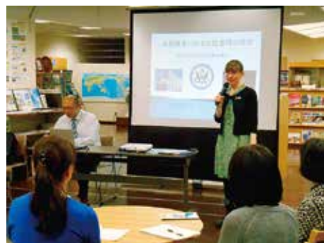
2014年3月7日(金) 講演「米国務省にみる女性登用の歴史」