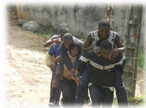
↑ ガボンジュニアチームの稽古風景