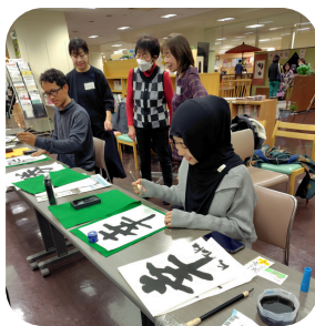
【日本文化体験】 体験のリーダーはボランティアのみなさんです