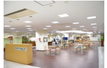
国際交流センター全景