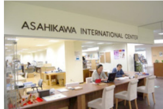
国際交流センター窓口