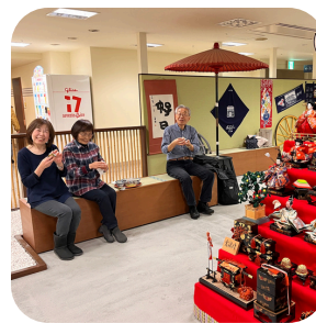
【雛飾り】 おしゃべりを楽しみつつお雛様を飾りました