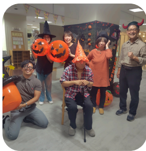
【ハッピーハロウィン】 楽しみながら飾り付けをしました